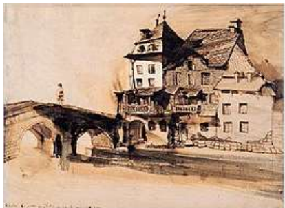
Schets door Victor Hugo van het huis waar nu zijn museum is

9 mei 2023 Na een heerlijk ontbijtbuffet in uw hotel wordt een bezoek gebracht aan Vianden. Vianden heeft vele leuke terrasjes en winkels. Ook kunt u een bezoek brengen aan het zeer goed gerenoveerde kasteel van Vianden dat zeker een bezoekje waard is. Het is het mooiste en meest belangrijke in de Ardennen en de Eifel. Een echte aanrader is om de stoeltjeslift te nemen die u naar 450 meter hoogte brengt. Eenmaal boven heeft u een fantastisch uitzicht op de omgeving en kunt u naar het kasteel lopen.