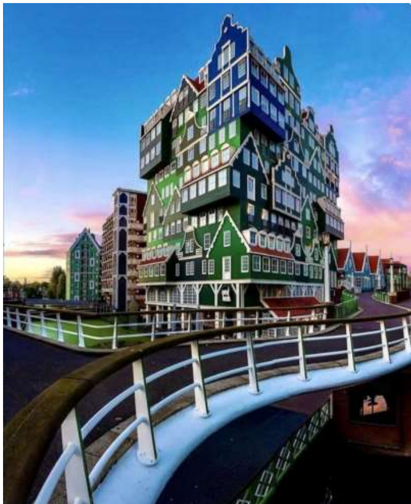
HOTEL INTEL ZAANDAM