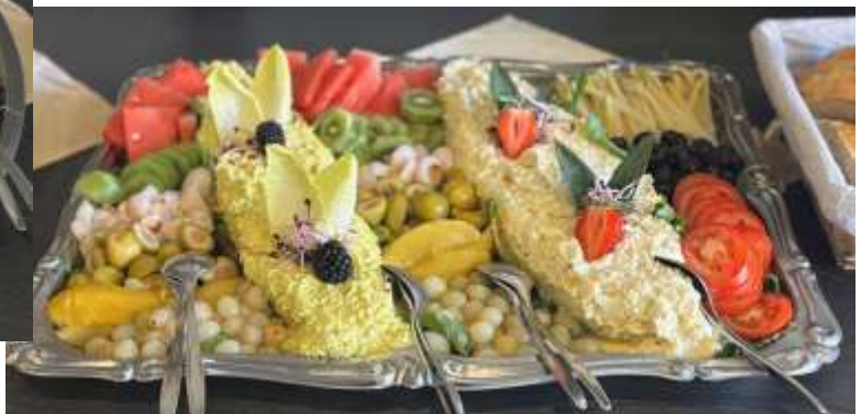
Warm en koud buffet in Ootmarsum